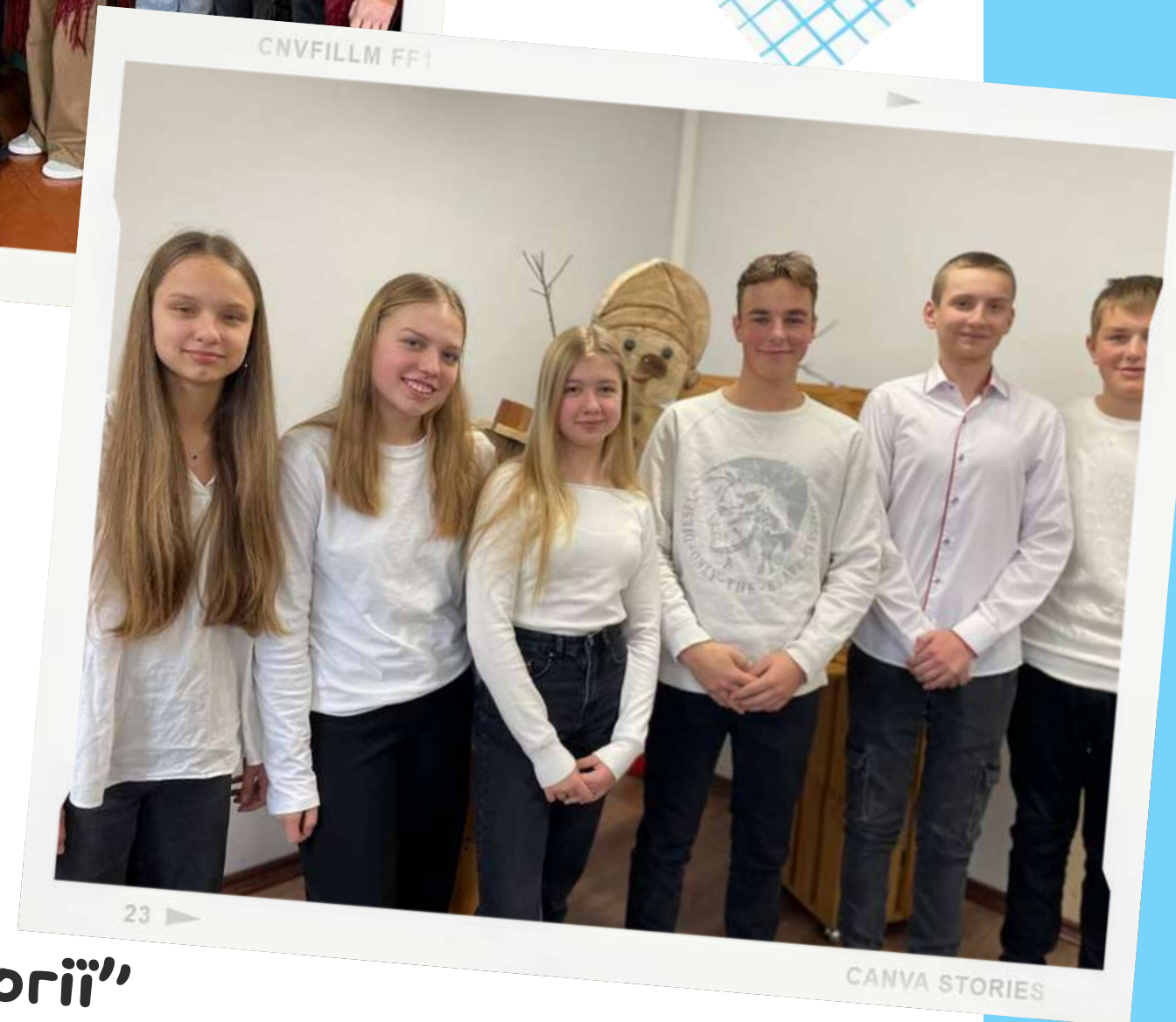
Команда "Вартові екології"