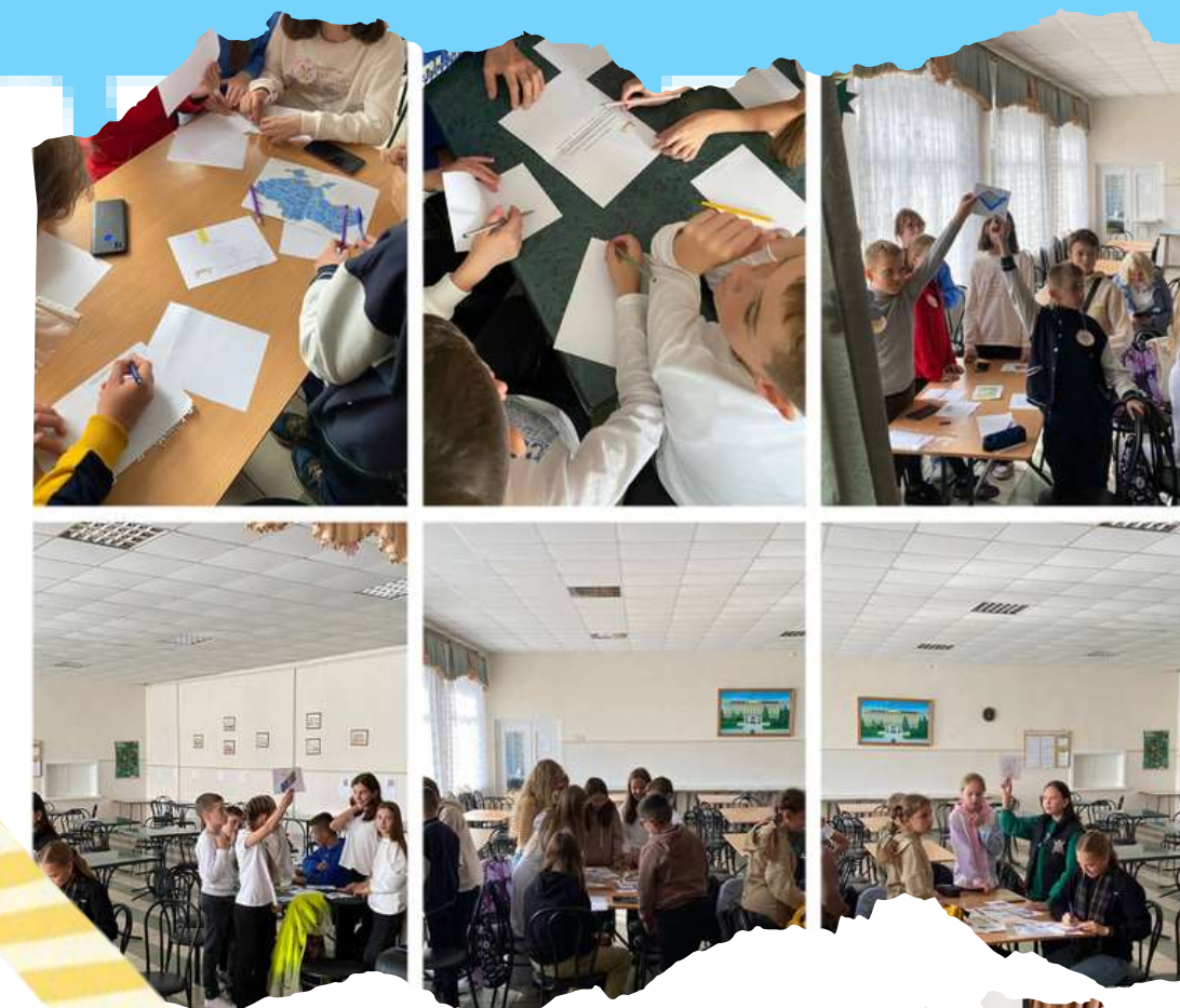
Квест "Пухнасті пригоди"