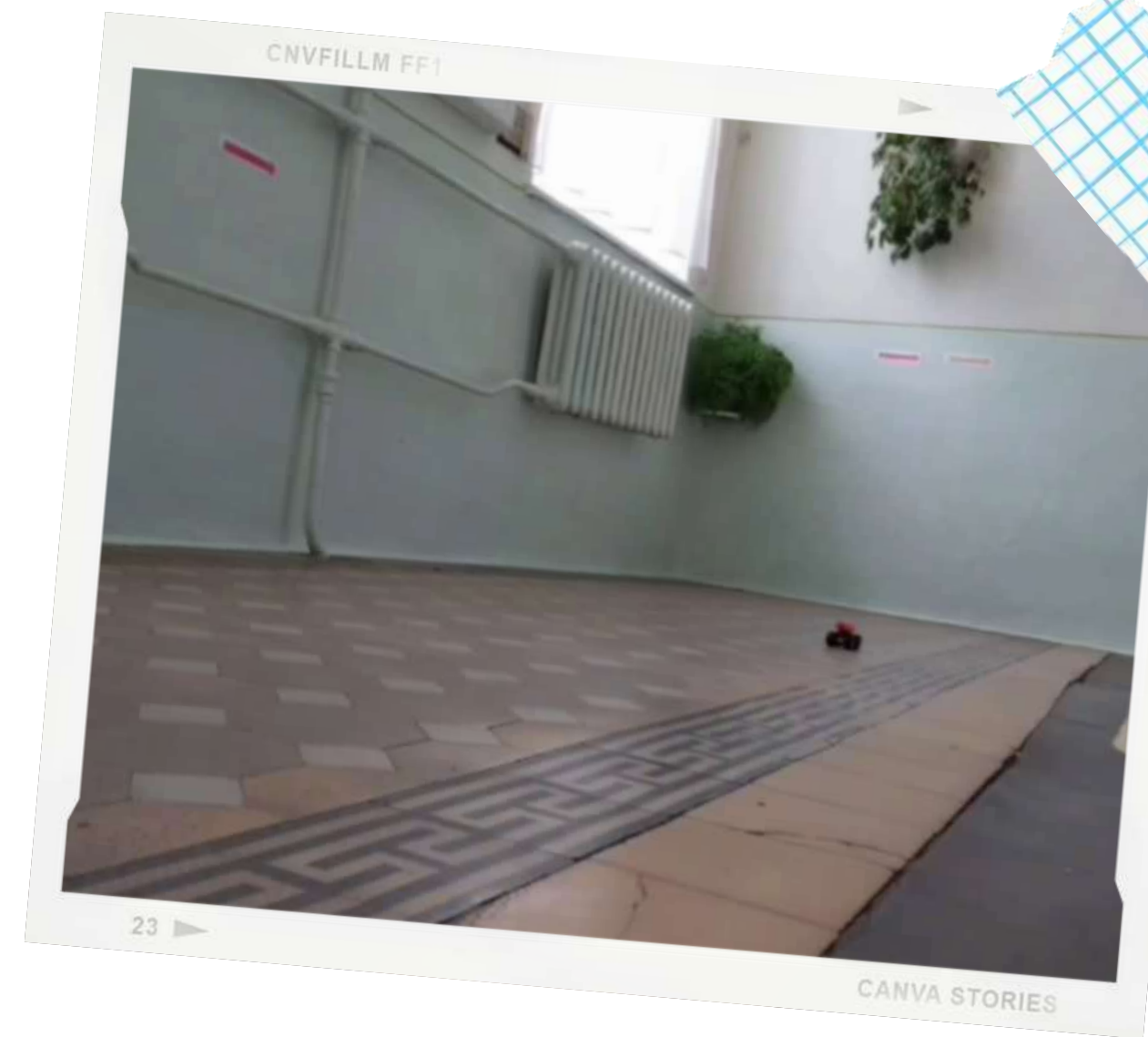
Стоп-моушн про архітектурну пам'ятку