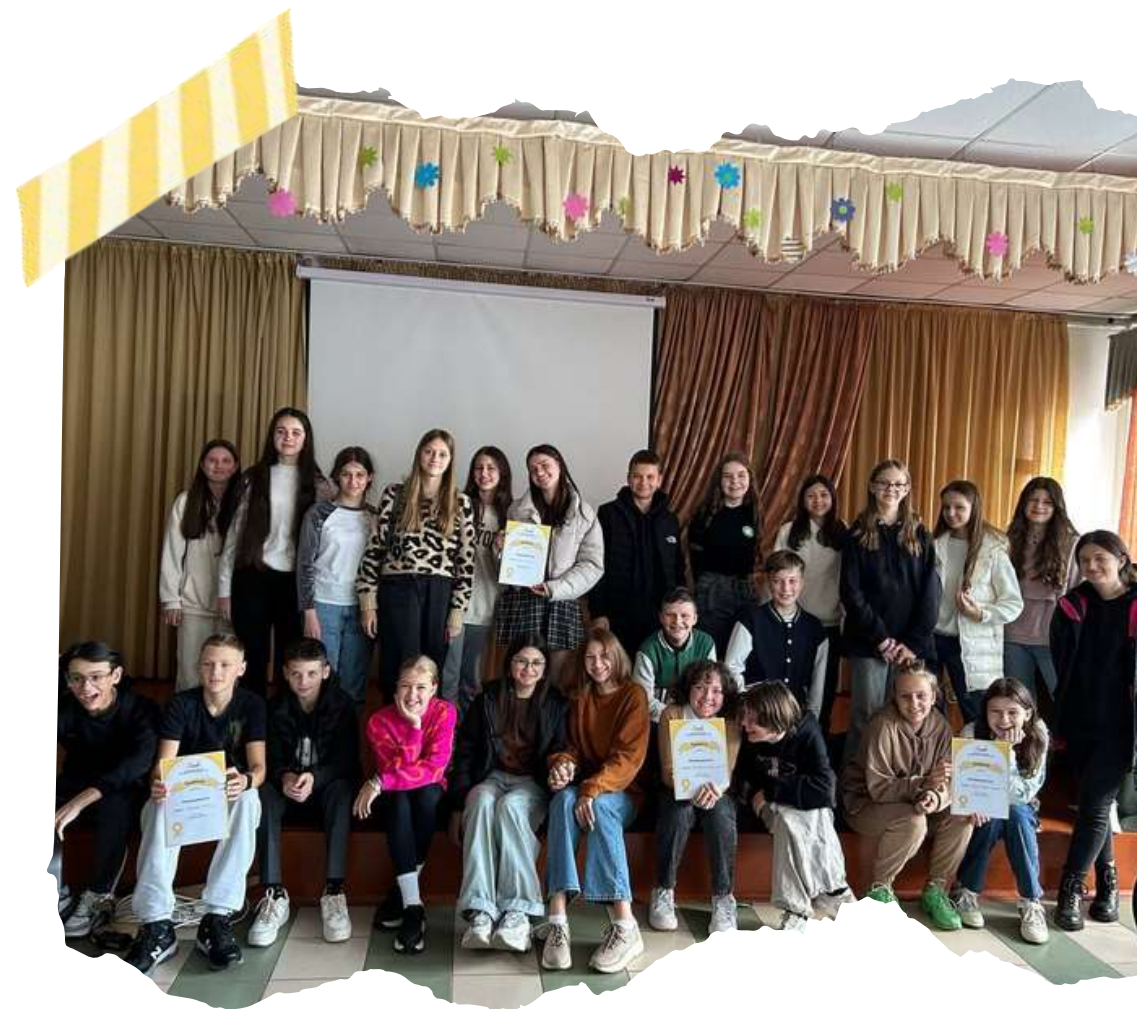
Інтелектуальна гра "Хвостата вікторина"