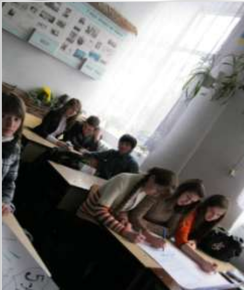
Вправа “Малюнок вдвох”

Мета: Формувати вміння конструктивної взаємодії.