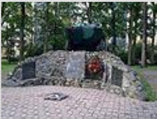
Пам'ятник воїнам- «афганцям» у Бучі