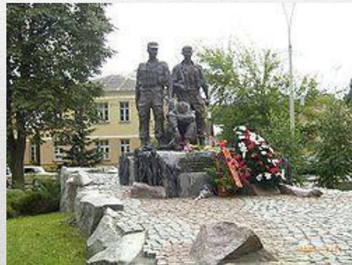
Меморіальний комплекс пам'яті воїнів України, полеглих в Афганістані, Київ