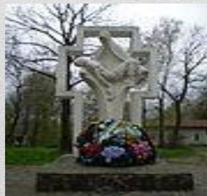
Пам'ятник воїнам, котрі загинули в Афганістані (м. Дрогобич)