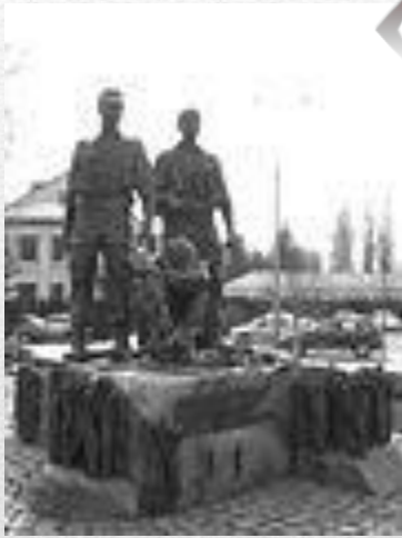
Пам'ятник воїнам - «афганцям» у Києві