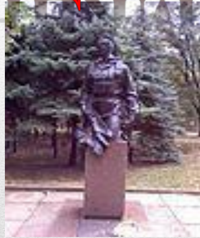
Пам'ятник воїнам - «афганцям» у Кривому Розі