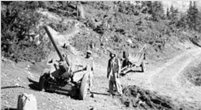
Афганські моджехеди з двома гарматами. 1984