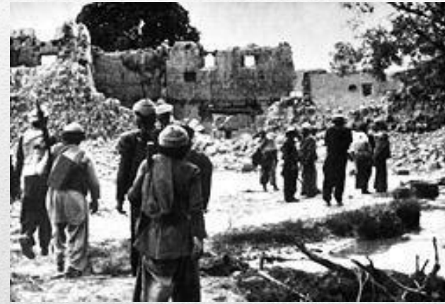
Селище моджахедів, зруйноване радянськими військами (1986)